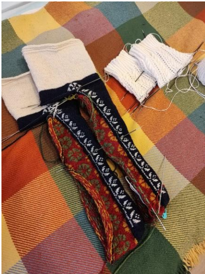
Kiilud ühes tükis