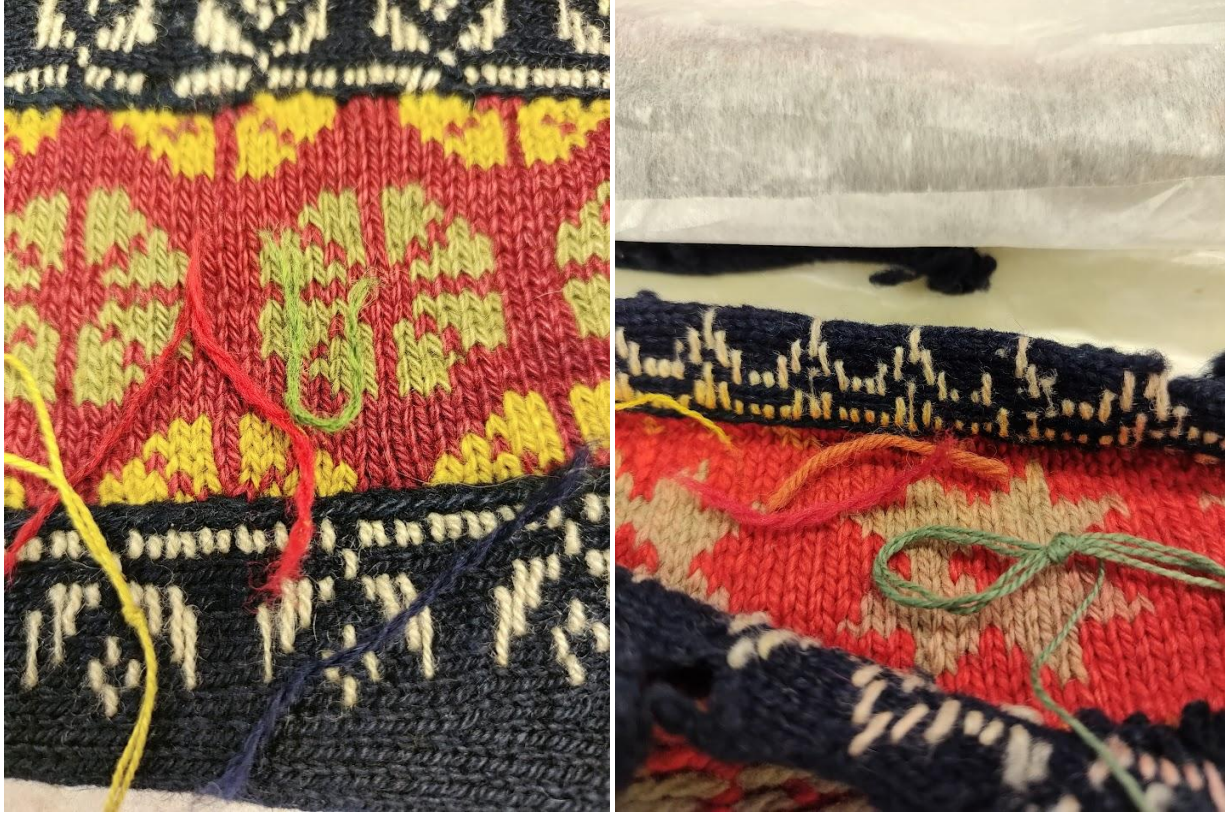
Museaalidel värvide määramine

Kudumiseks on vaja pestud eri värvi kahekordset lambavillast lõnga, sukavardaid ja ringvardaid nr 1,75 (või teisi vastavalt lõngale ja kudumistugevusele).