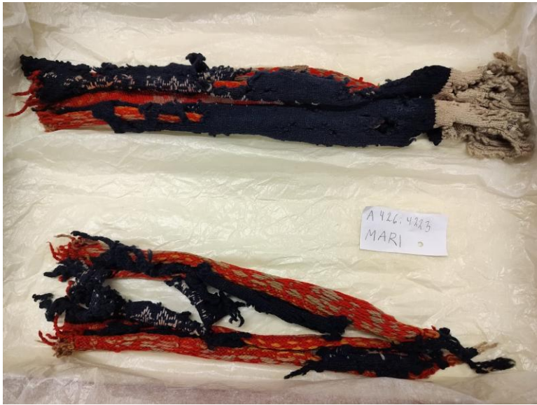
Museumis sukkadega tutvumas