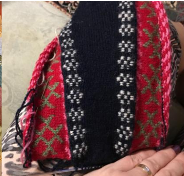
Kiilud kahes osas

NB! Kui kiil tuleb ühes tükis, siis ei kahandata ka tallapõhja silmuseid.